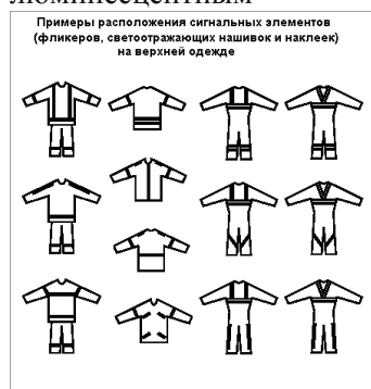
Рис.1. Примеры расположения сигнальных элементов (фликеров, светоотражающих нашивок и

Стандартная ширина световозвращающих лент, пригодных для самостоятельного оформления своих вещей, одежды - 12, 25 и 50 миллиметров. На слабо освещённой улице - поможет и самодельный фликкер, из подручных материалов, например, белый лист обычной писчей или глянцевой бумаги, поднятый повыше (чтобы было видно с любой стороны), сумка поярче или цветастый целофановый пакет, посветлее. При наличии и возможности, на сигнальные поверхности, заранее наносится световозвращающая краска-спрей (из баллончиков), самоклеющаяся плёнка или производится печать люминесцентным красителем.